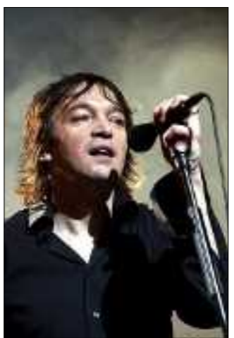
Cali revient sur scène avec son troisième album « Espoir ».

Lundi 18. L'Armstrong Jazz Ballet mèlera danse classique et danse africaine, à 21 h, place Voltaire. En-