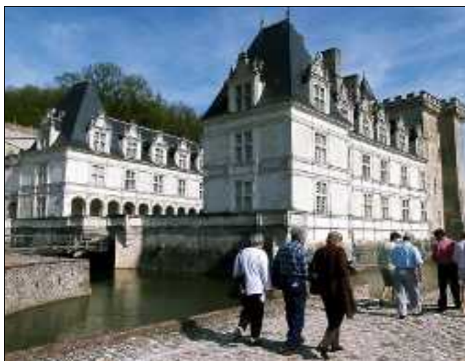
Pourtant toujours très prisé par la clientèle locale, le château de Villandry a vu la proportion de visiteurs d'Indre-et-Loire diminuer en juillet 2008 par rapport à juillet 2007.

La proportion de Tourangeaux dans la fréquentation des sites touristiques d'Indre-et-Loire constitue-t-elle un indice pour quantifier le nombre de ceux qui ne se sont pas « expatriés » en juillet ? Pas sûr.