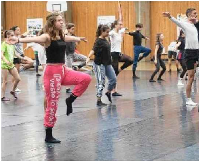
Derniers cours avant trois jours de répétition du spectacle final.