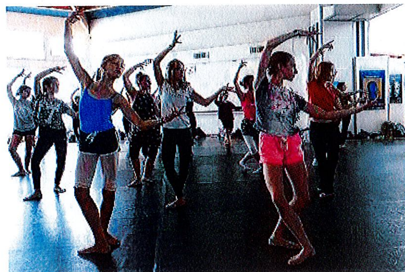
> GRÂCE. La danse indienne a cette particularité de proposer des mouvements qui font intervenir toutes les parties du corps, et notamment les mains.