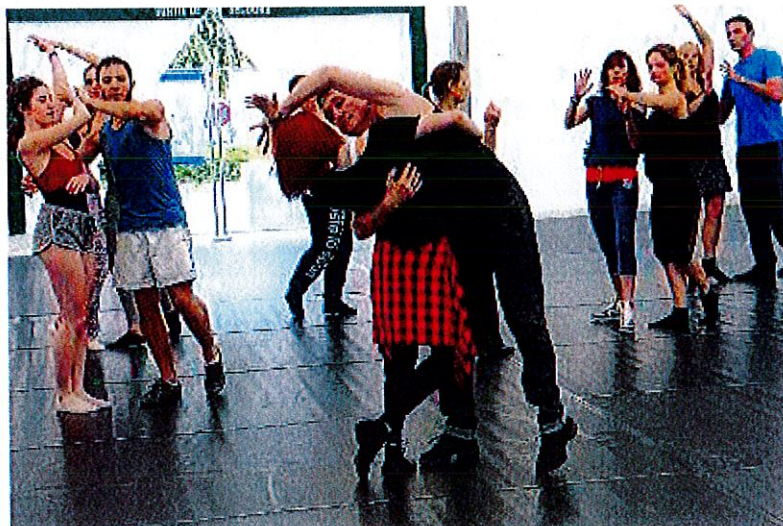
> MODÈLE. La danse sportive nécessite une gestuelle parfaite et une précision que les enseignants se chargent de montrer à leur élèves.