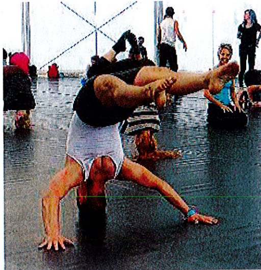
> A L'ENVERS. La capoeira est une discipline qui exige beaucoup de souplesse et de d'équilibre.