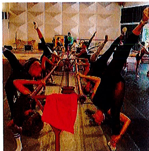
> A LA BARRE. Les cours de danse classique voient tous les ans leur niveau augmenter.