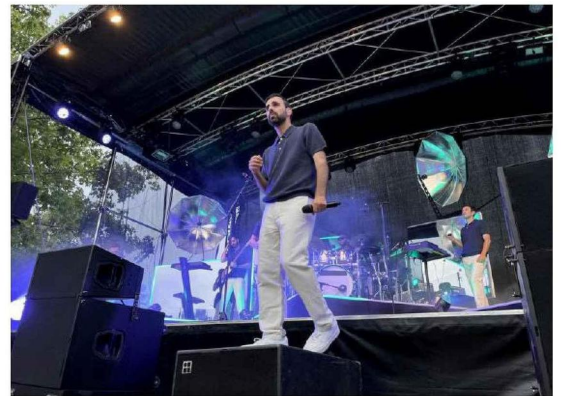
Boulevard des airs sera sur scène samedi 15 août, sur la place Voltaire de Châteauroux.

Ex-membre des Trois Cafés Gourmands, Mylène Madrias, présente à la présentation du festival, remet les compteurs à zéro pour se dévoiler dans un univers pop et surtout rock, samedi 15 août. Sur scène dès